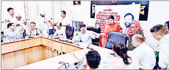
जीद। समाधान शिविर में शिकायतें सुनते एडीसी।