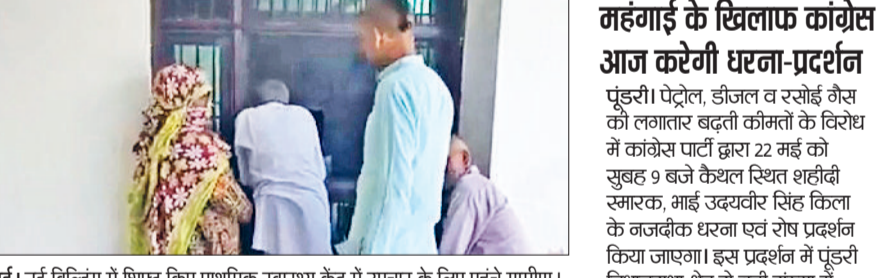
पाई। नई बिल्डिंग में शिफ्ट किए प्राथमिक स्वास्थ्य केंद्र में उपचार के लिए पहुंचे ग्रामीण।