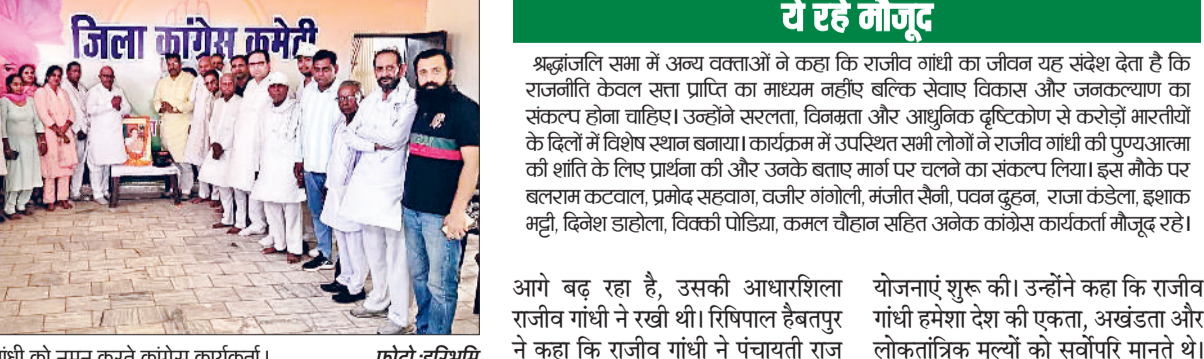
जींद। पूर्व प्रधानमंत्री राजीव गांधी को नमन करते कांग्रेस कार्यकर्ता।