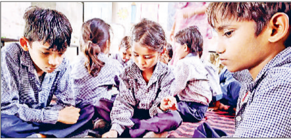
जीद। गतिविधि में भाग लेते हुए बच्चे।