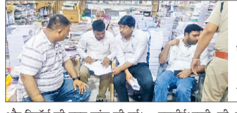
कैथल। पिहोवा चौक पर किताबों की जांच करते अधिकारी।