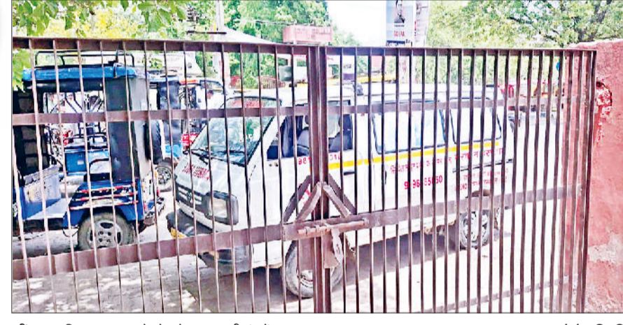
जींद। नागरिक अस्पताल के गेट के पास खड़ी एंबुलेंस।